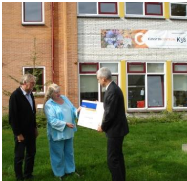
Uitreiking cheque Rabobank