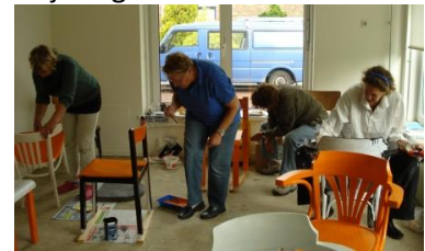
K38 Corner-stoelen verven