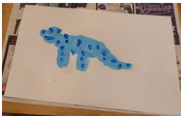
groep 3 & 4