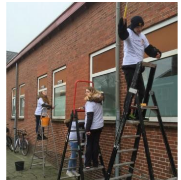
scholieren aan de slag via NLdoet

K38 heeft in samenwerking met de Teken- en Schildergroep Roden deze prints aangeschaft om de