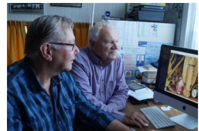
Het gouden duo

Er wordt op dit moment door beide heren hard gewerkt aan nieuw aanbod voor cursusjaar 2016/2017. We houden u op de hoogte!